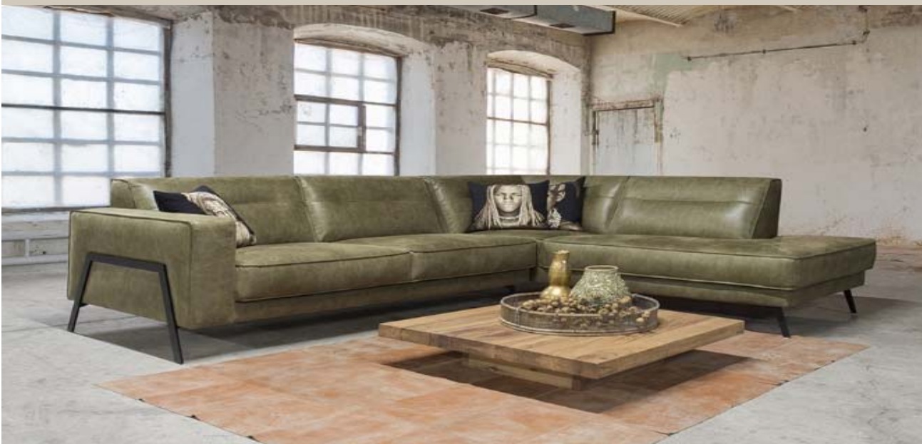
* L60 Senegal Olive